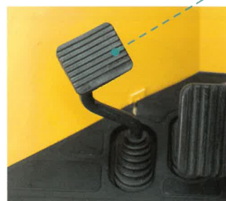
足踏み式パーキングブレーキ