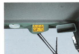
バックミラー&ルームライト