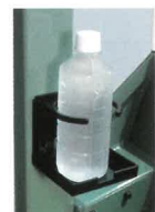
ドリンクホルダー