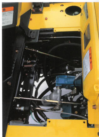
床板は簡単に外せます。

後部ボンネットが大きく開くので、キャビン仕様でも点検・整備が楽々。さらに、床板を外せばエンジンからHSTミッションまでのパワーラインがより確認しやすく、必要な部位に簡単に手が届きます。