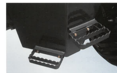
乗降用ステップ(V3は1段ステップ)